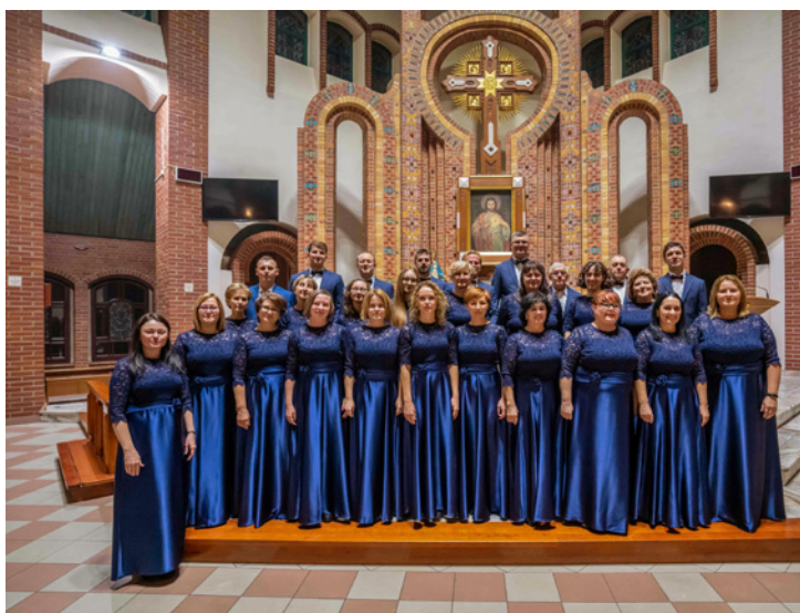
Chór parafii w Piasku w strojach zakupionych przy wsparciu LGD Ziemi Pszczyńskiej

Rozwój Lokalny Kierowany przez Społeczność (RLKS) to niezwykle istotny instrument rozwoju terytorialnego, odgrywający znaczącą rolę w rozwoju obszarów wiejskich w naszym kraju.