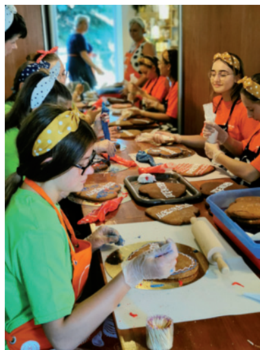
Aktywizujące warsztaty cukiernicze z tradycyjnych wypieków dla młodzieży z terenu LGD „PRYM”.

nych przedsięwzięć, zarówno inwestycyjnych, jak i o charakterze aktywizującym lokalną społeczność. Szerokie spektrum wsparcia oferowanego za pośrednictwem LGD łączy jedno – z funduszy unijnych dofinansowywane są inicjatywy o charakterze oddolnym, odpowiadające faktycznemu zapotrzebowaniu lokalnych społeczności. Dlatego w obli-